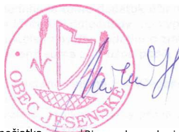
pečiatka a podpis zodpovednej osoby užívateľa