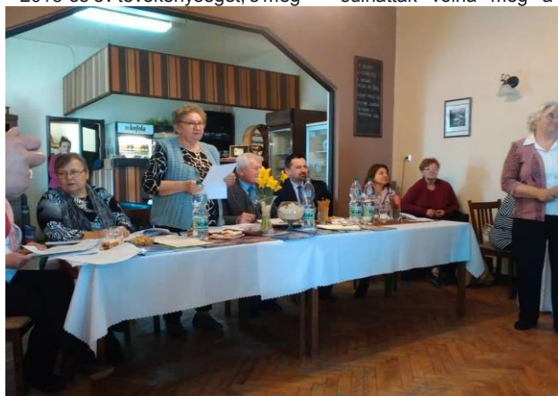
vitatták a 2017-es év munkatervét. anyagi támogatása nélkül, ame-

A hivatalos rész után gratuláltunk a tizenhárom jubilánsunknak s átadtuk nekik az ajándékokat. A fellettes szervek munkatársainak jókívánságai és polgármester úr biztató szavai lelkesítenek bennünket a további munkánkban. A találkozót estebéddel fejeztük